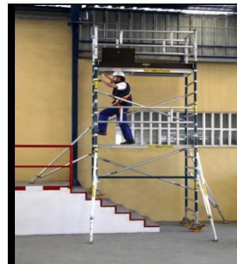
Procedimiento de montaje de andamios móviles. Clase práctica