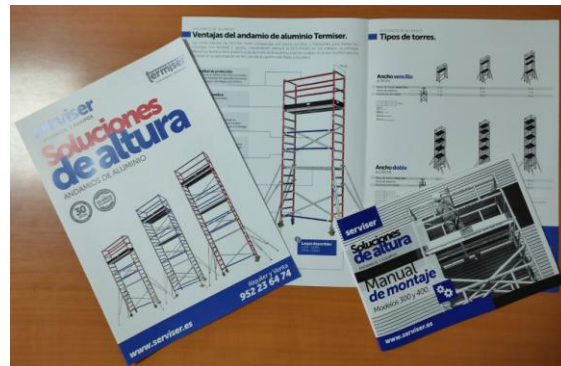
Manuales de formación y catálogos técnicos